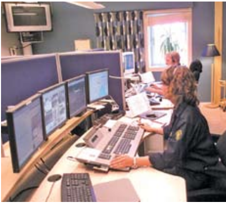
Koppling till Metria Transport/central ger ett kraftfullt verktyg för krisledning.