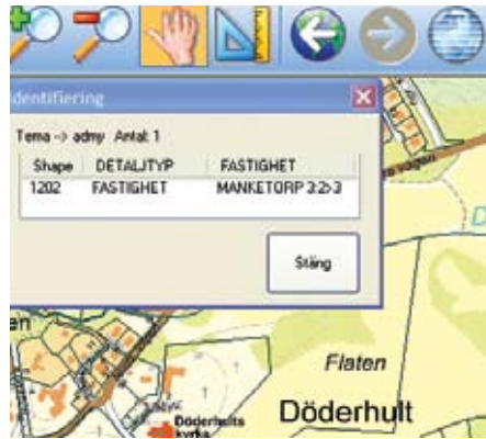
Genom att peka i kartan får du reda på fastighetsbeteckning och/eller ägare.